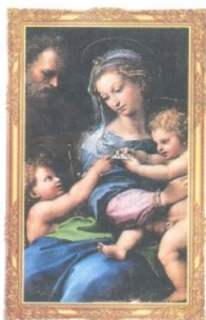
La Virgen de la Rossa. Rafael. Museo Nacional del Prado, Madrid.